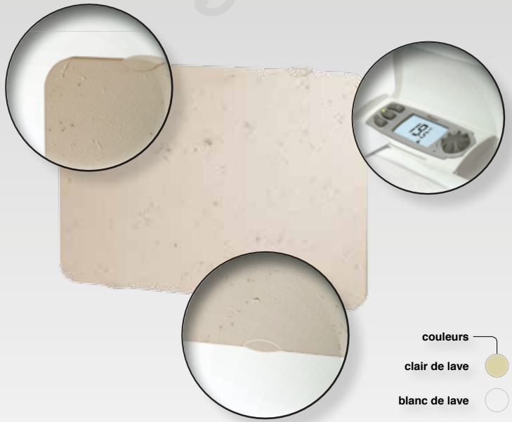
Carrosserie arrière blanche

PROGRAMMATION Pour optimiser les économies d'énergie, Naturay peut faire l'objet d'une programmation centralisée par fil pilote et radiofréquence ou par cassette individuelle fil pilote ou courant porteur.