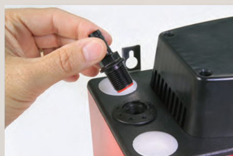
Clapet de sécurité

Des voyants rouges, jaunes et verts indiquent le statut de la pompe. Le vert pour la puissance, le jaune pour le fonctionnement de la pompe et le rouge pour une alerte importante. Les ongles se trouvent à une distance conviviale de 20 cm.