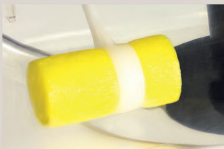
Un flotteur qui flotte

Clapet de sécurité amovible pour un entretien facilité