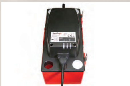
Quatre orifices d'entrée

Les ongles incassables inox sont en forme de trou de serrure pour un montage facile. Les ongles se trouvent à une distance conviviale de 20 cm.